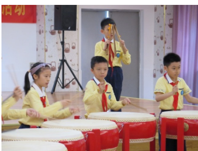
三元坊小學中樂團及合唱團渾身解數的表現，令觀眾讚嘆不已。