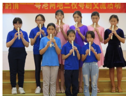
慈天同學表現木笛、合唱及體育舞。