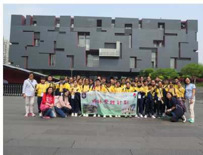
參觀廣東歷史博物館

沙面是廣州西方特色的建築群，是晚清時期洋人聚居的地方，現已被定做全國重點文物保護單位。