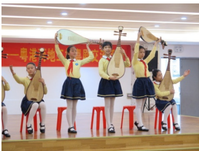
三元坊小學中樂團及合唱團渾身解數的表現，令觀眾讚嘆不已。