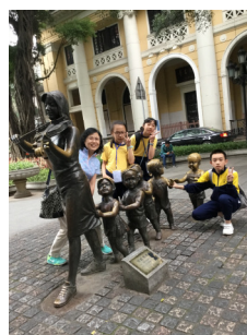
拍攝成功，完成目標，YEAH!