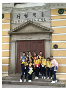
原來除了洋人居住外，還有台灣人呢!