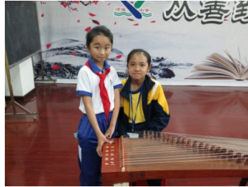
我們也有機會嘗試演奏中樂!