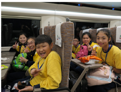
同學們乘坐高鐵到廣州。