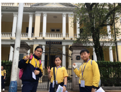
此建築的用途已經改為博物館之用。