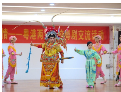
從化河濱小學的粵劇團表演也是很精彩。