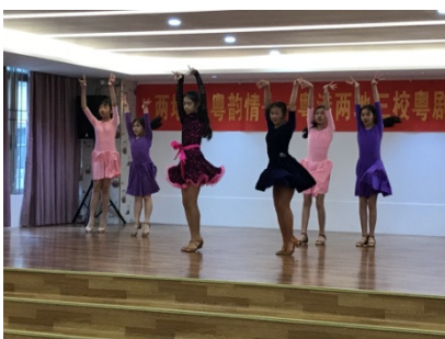
慈天同學表現木笛、合唱及體育舞。