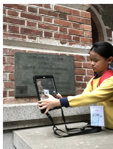
同學用平板電腦掃描標籤以獲取資訊。

沙面是廣州西方特色的建築群，是晚清時期洋人聚居的地方，現已被定做全國重點文物保護單位。