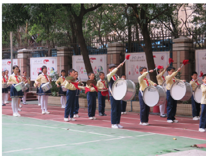
三元坊小學儀仗隊歡迎我們到訪。