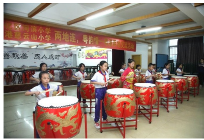
古箏隊和鼓樂隊表演十分出色，讓我們聽出「耳油」！