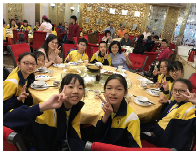
同學們正品嚐廣東點心。