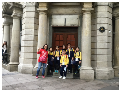
我們第一個任務就是要小組合照呢!